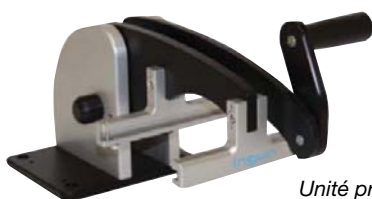
Unité presseur Drive unit MA60